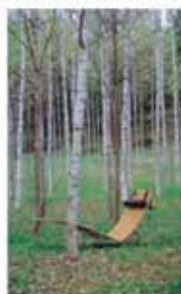
アートワークス・デザイン 高橋 孝