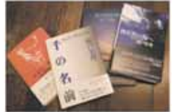
著作の一部。講演やイベント等もこなす。詩、批評、エッセイ、書評など、日々多岐にわたる執筆活動に打ち込んでいます。今年も数冊の詩集に向けて準備中とのこと。

人がいて、そこに住まいがある。 家で過ごす醍醐味、そして満ち足りた瞬間、 そんな暮らしの情景を訪ねる——悦楽時間への旅。