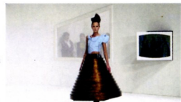
ファッション・チャラン(アフターフーズ)コレクション 2000-01年秋冬 Hussein Chalayan, Afternoons collection (autumn/winter 2000)