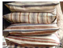
生地フィヨルド3,900円/mから