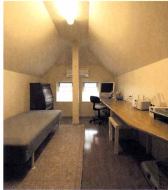
〈写真右〉息苦しさを感じないゆとりのロフトスペース。