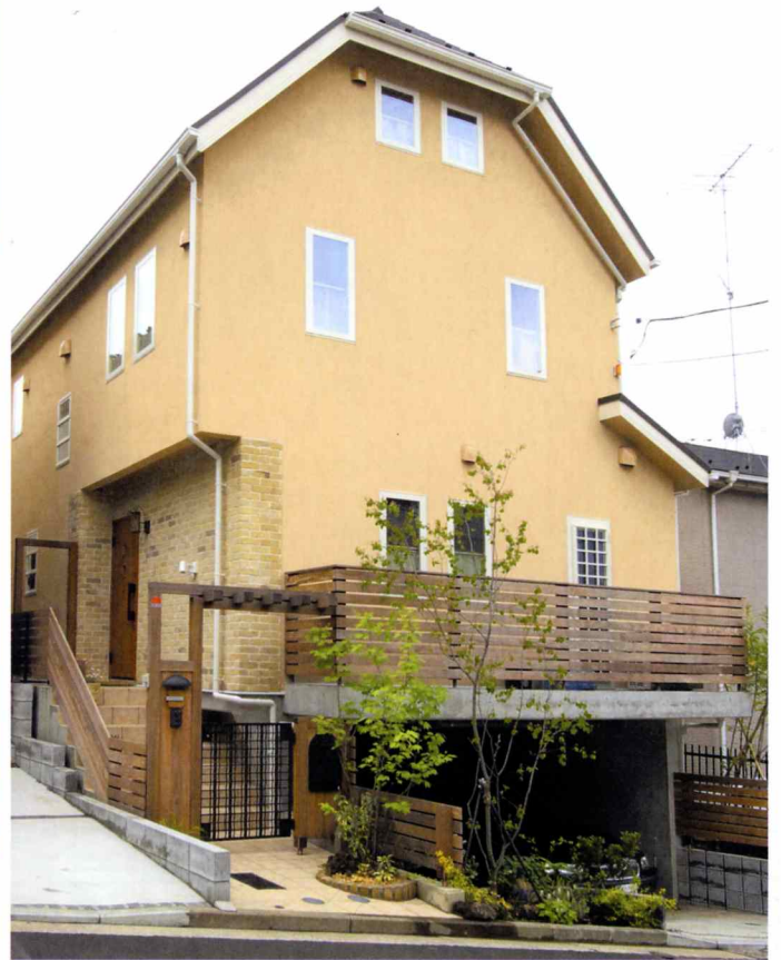
玄関のアプローチ部分にはベルギー産ハンドメイドレンガを使用。外壁ともマッチした温かい雰囲気。