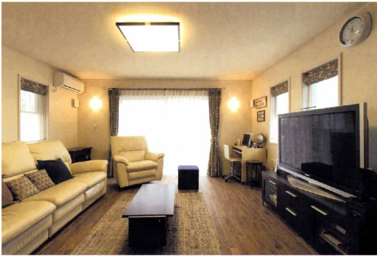
〈写真上〉明るく開放的なリビング。インテリアにも馴染むばぐりの無垢フローリング。間接照明が落ち着いた雰囲気を出している。