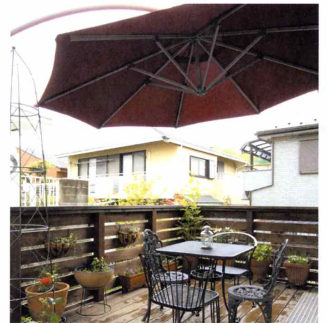
堅牢なイベ材のウッドデッキ。

シックなしばぐりの無垢フローリング、開放的な三方の窓、間接照明が心地よいリビングはくつろぎのホームシアター。奥さまの蒐集した上品な雑貨がアクセントを添えるダイニング。家とインテリアがマッチした空間が心地いい。菜園の採れたて野菜がテーブルを彩り、晴れた日にはウッドデッキでティータイム……家族の団らんや趣味の時間を大切にするK邸には、そんなゆとりの時間が流れている。